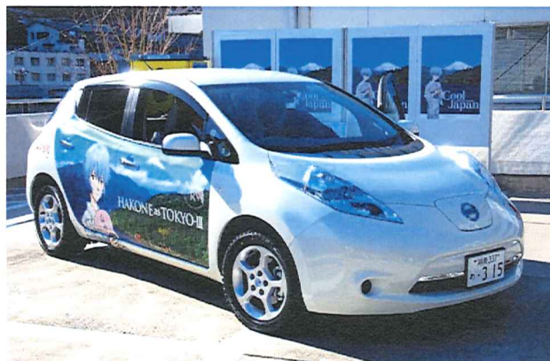
展示予定の箱根町所有の 日産自動車「リーフ」