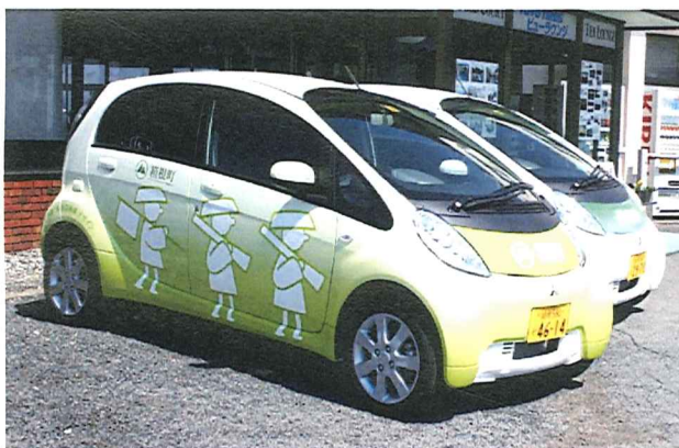
展示予定の箱根町所有の 三菱自動車「i-MiEV」